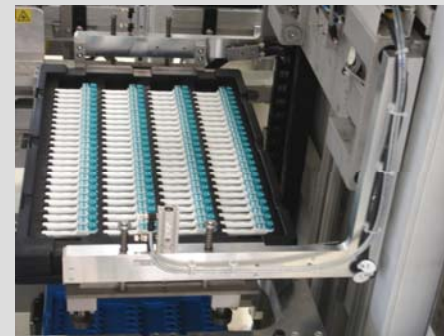
Kunststoffziehtrays für Kunststoffformteile

Als Ladungsträger für eine materialschonende und geordnete innerbetriebliche Logistik sowie für den Versand, palettieren oder depalettieren wir in/aus Kunststofftrays , Blister , KLT-Boxen etc.