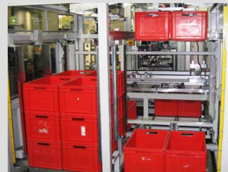
Doppelgreifsystem für KLT-Boxen Palettierung