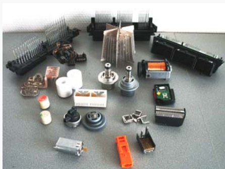
...Elektromotoren, Zahnbürsten etc. Wir haben für alles eine Lösung!