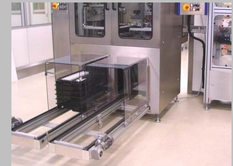
Automatische Zu-/Abführung der Paletten über Doppelgurt- oder Rollenförderer

Durch die automatische Zuführung der Werkstückträgerpaletten erreichen Sie eine unterbrechungsfreie und sichere Produktion von mehreren Stunden. Die Zuführung kann auch platzsparend über Transportwagen erfolgen.