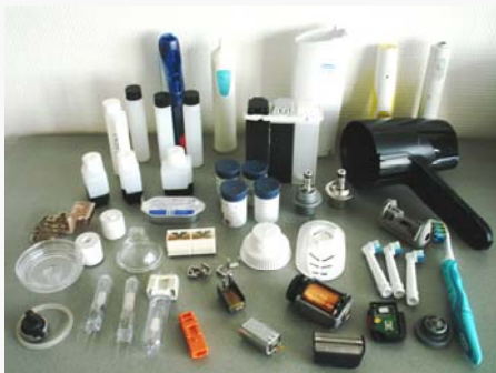
Egal ob Glaskörper, Kunststoffteile...

Mit unseren Palettierern erhalten Sie vollautomatische Systeme zum Palettieren Ihrer aus der Fertigung stammenden Produkte oder zur Bereitstellung von Kleinteilen für nachfolgende Montagelinien.