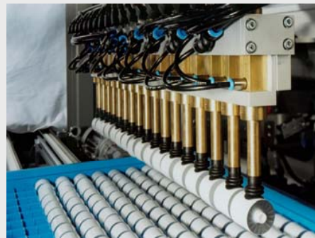
Mehrfachsauggreifsystem für eine Reinraumanwendung

Flexible Gestaltungsmöglichkeiten in Bezug auf Handling/Greiftechnik , Werkstückträger und Übergabehöhe gewährleisten eine optimale Anpassung an Ihre Produktion.