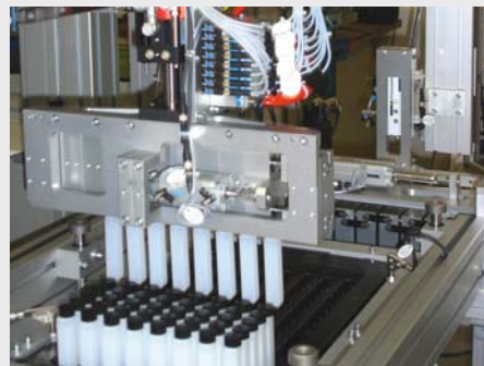
8-fach Greifsystem zur Traybeladung mit Kunststoffflaschen