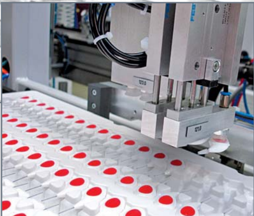
Robotergestütztes Handling für Interdentärbürsten