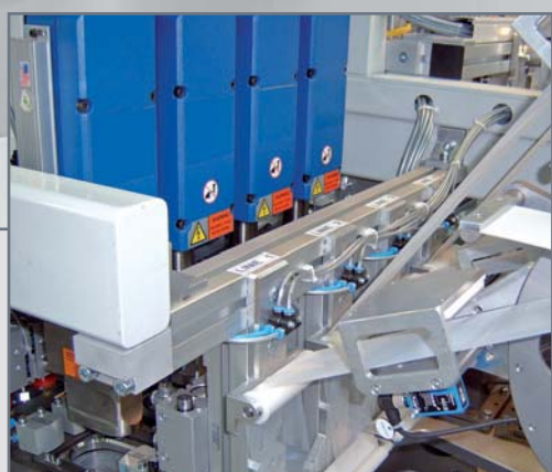
Ultraschalltrenn- und -schweißvorrichtung für Filtersiebe